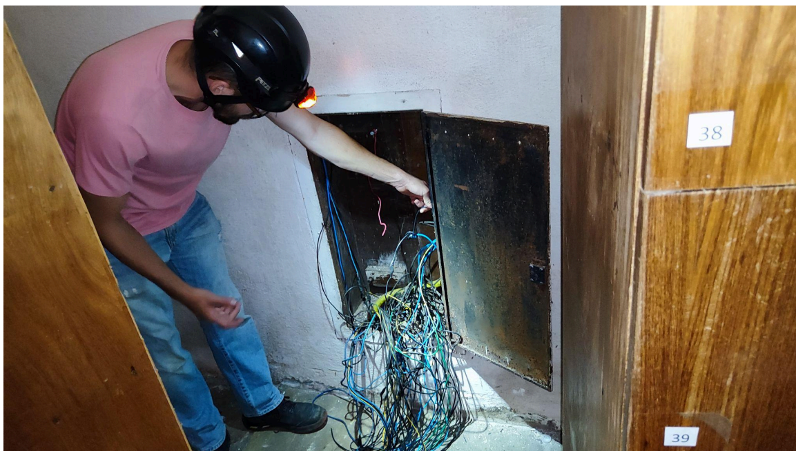
Início dos serviços de infraestrutura elétrica Autoria: Francielle Ferreira Data: 13/02/2025