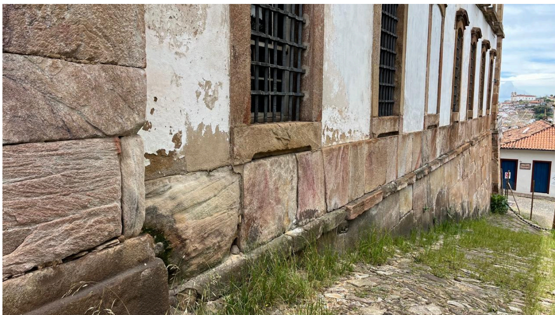
Apresentação do estado de conservação das alvenarias e elementos em cantaria - Fachada Posterior Autoria: Francielle Ferreira Data: 13/02/2025

Ao final, foi solicitado ao proponente que sejam formalizadas junto à Plataforma Semente quaisquer alterações necessárias para os projetos, bem como todos os remanejamentos de rubrica necessários diante das possíveis mudanças de escopo.