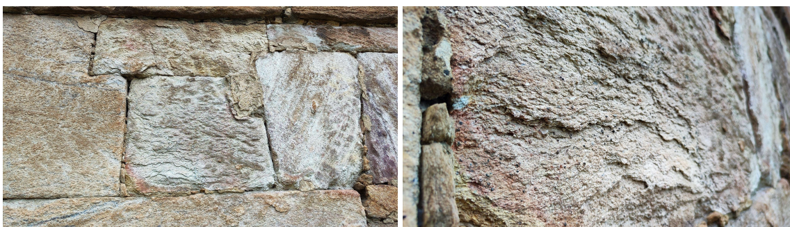
Apresentação do estado de conservação dos elementos em cantaria - Fachada Posterior Autoria: Francielle Ferreira Data: 13/02/2025