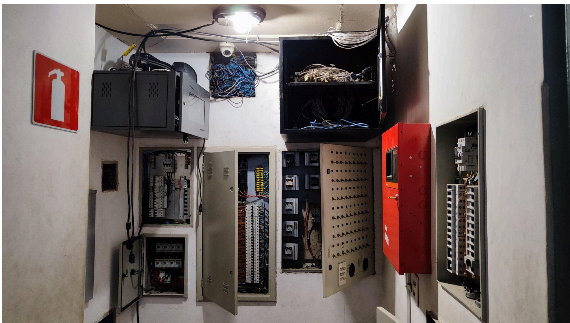
Iluminação provisória Autoria: Francielle Ferreira Data: 13/02/2025