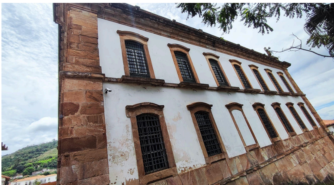
Apresentação do estado de conservação das alvenarias e elementos em cantaria - Fachada Posterior Autoria: Francielle Ferreira Data: 13/02/2025

que, especialmente na alvenaria posterior, existem trechos com desgaste tanto das alvenarias revestidas em argamassa de cal, quanto dos robustos elementos de embasamento e enquadramentos construídos em cantaria, conforme ilustram as imagens abaixo. A equipe técnica da Plataforma Semente questionou qual seria a metodologia de intervenção nestas áreas desgastadas e a equipe técnica responsável pelo projeto informou que irá consultar os órgãos tombadores sobre qual metodologia seguir nestas situações específicas.