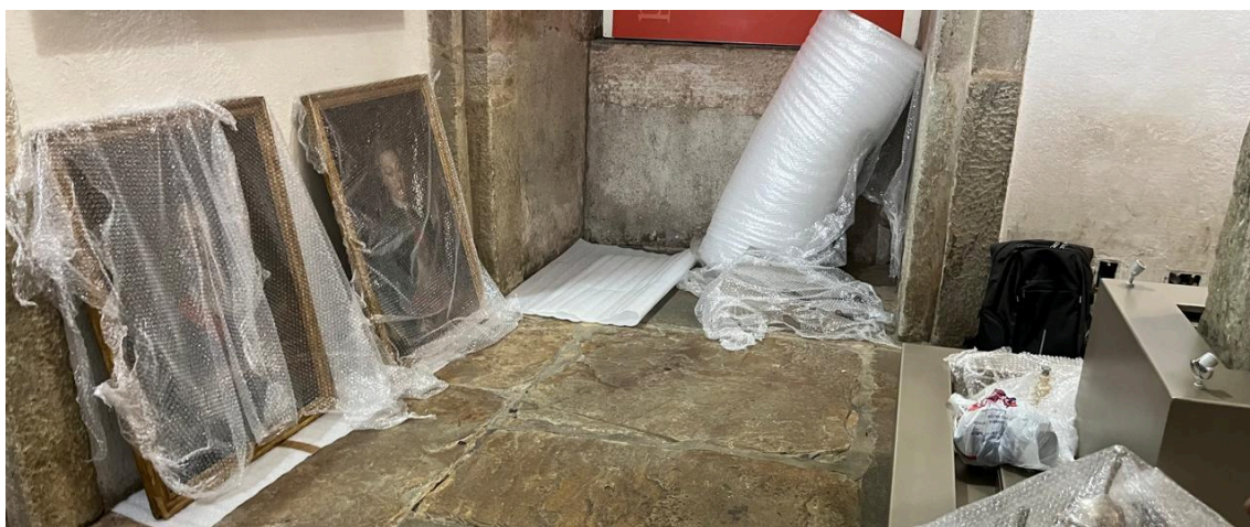
Acervo transferido de sala e acondicionado para realização das atividades de conservação preventiva