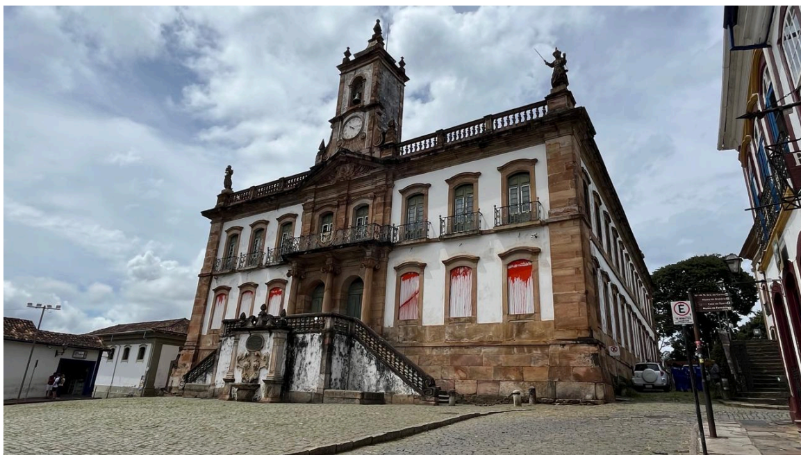
Museu da Inconfidência, em Ouro Preto/MG.