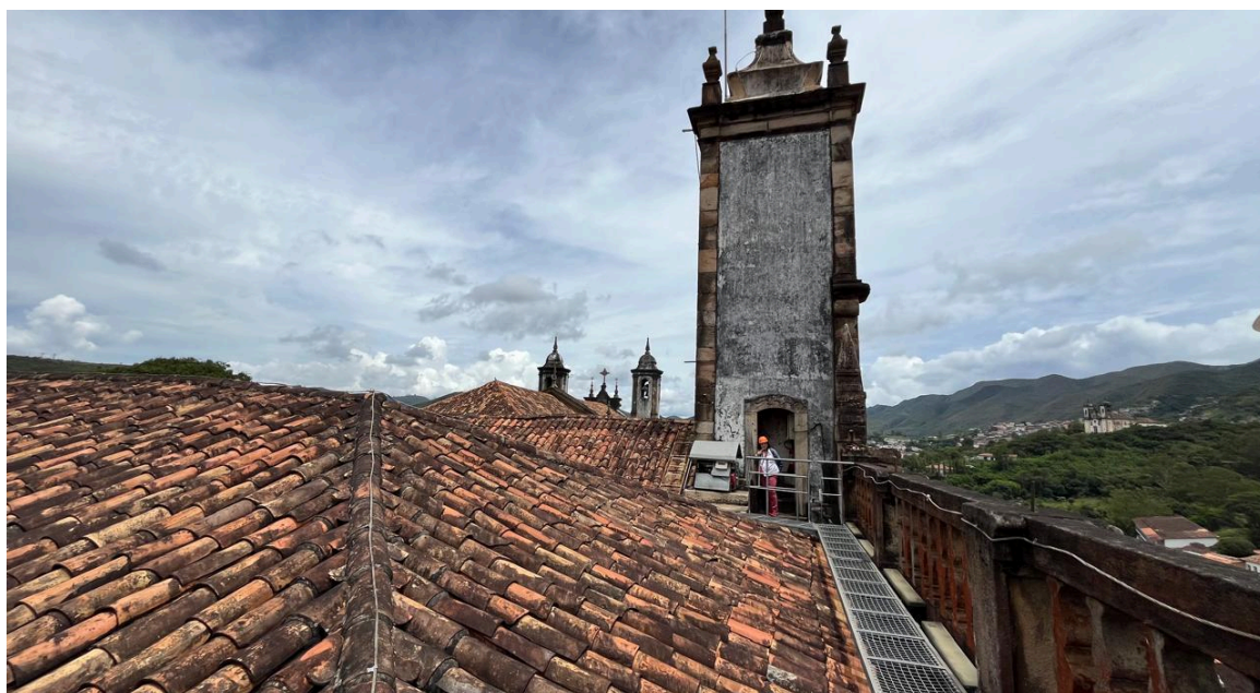
Apresentação do estado de conservação das cantarias da cobertura da edificação Autoria: Francielle Ferreira Data: 13/02/2025

Após análise das intervenções internas ora em curso, a equipe técnica se dirigiu à cobertura da edificação para analisar o estado de conservação das cantarias que serão higienizadas conforme as metodologias estabelecidas pelo Instituto do Patrimônio Histórico e Artístico Nacional - IPHAN.