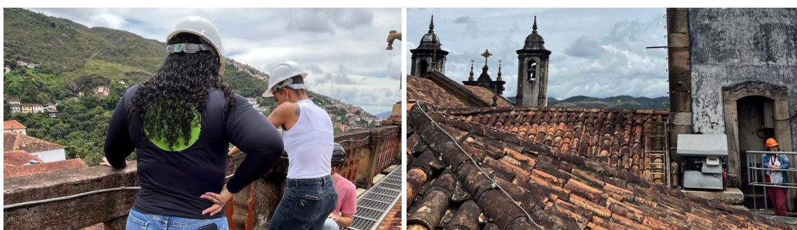
Apresentação do estado de conservação das cantarias da cobertura da edificação Data: 13/02/2025

Ainda na parte externa da edificação, o estado de conservação das alvenarias externas foi apresentado pela equipe técnica responsável pelo projeto. Foi verificado